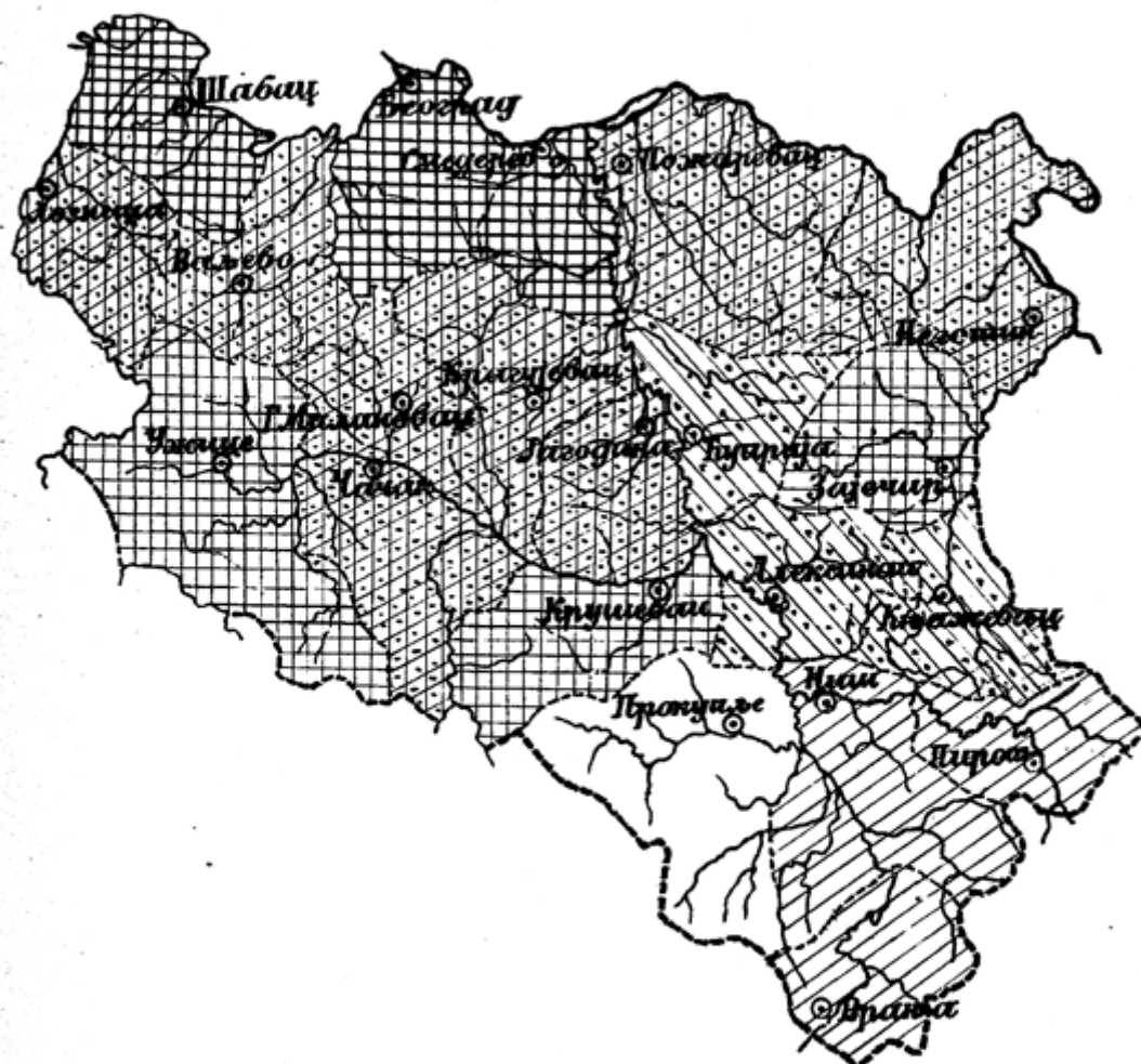
Карта писмености у сељака

често нема учитеља, и оне стоје празне. Осем тога, и међу учитељима, којима је поверена настава у основним школама, огромна већина није стручно спремана за учитељски посао. Како пак штетно на развитак омладине народне